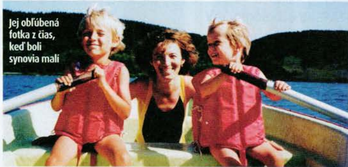
Jej obľúbená fotka z čias, keď boli synovia mali