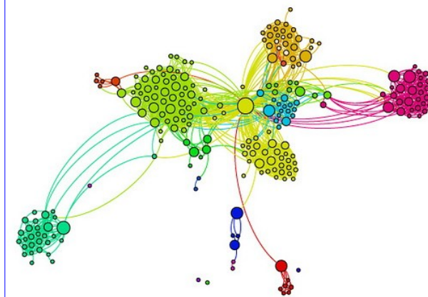
Obr. 1.: Ukážka grafu sociálnej siete.

profesorka na Fakulte informatiky a informačných technológií Slovenskej technickej univerzity v Bratislave